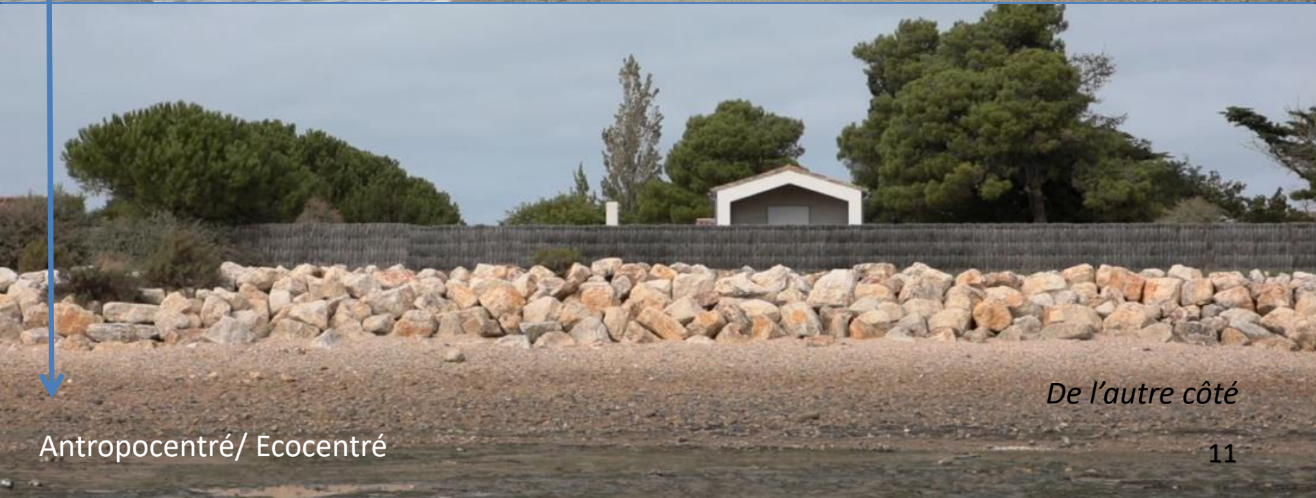
De l'autre côté